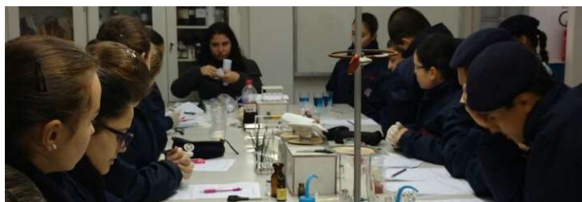
Figura 01: Trabalho em equipe no laboratório.

A Figura 01 representa o momento em que os estudantes estavam preparando as amostras para posteriormente serem analisadas.